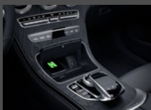
Draadloos oplaadsysteem (897)