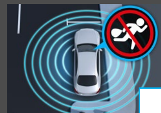
Anti-diefstalpakket (P54) € 484