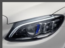
MULTIBEAM ILS met ULTRA RANGE (642+628)