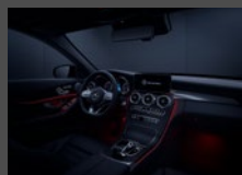
Sfeerverlichting in 64 kleuren (877)