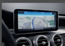
COMAND Online (531)