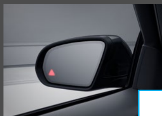
Dodehoekassistent (234) € 545