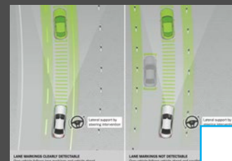
Rijassistentiepakket Plus (23P) € 2.541