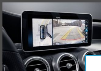
Parkeerpakket met 360°-camera (P47) € 557