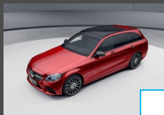
Panoramaschuifdak (413) € 1.718