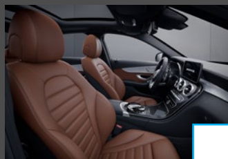
Lederen bekleding (2XX) (i.c.m. Business solution/AMG) € 1.984/€ 1.440