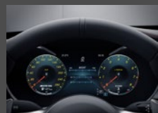
12,3" digitaal instrumentencluster (464)