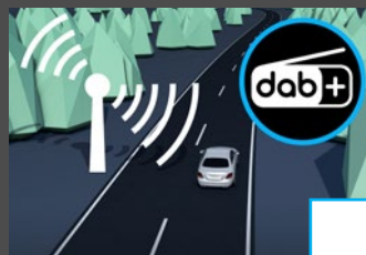
Digitale radio (537) € 303