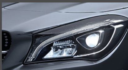
High-performance led-koplampen (632)