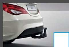
Trekhaak 2) (550) € 956