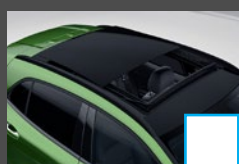
Panoramisch schuifdak (413) € 1.440