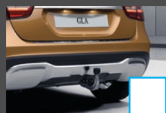
Trekhaak (550) € 956