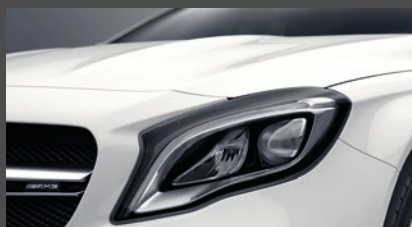
High-performance led-koplampen (632)