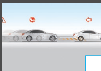
Rijassistentiepakket (23P) € 3.085