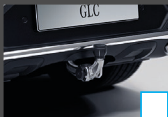
Trekhaak (550) € 1.162