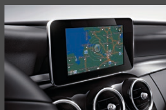
AUDIO 20 CD en Garmin® MAP PILOT navigatiesysteem (522+357)