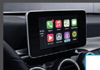
Smartphone Integratie (14U) € 424 Alleen in combinatie met Audio 20 (522)