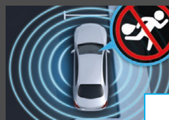
Antidiefstalpakket (P54) € 484