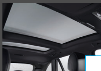
Panoramaschuifdak (413) € 1.718 Op GLC Coupé alleen schuifdak (414) € 1.271