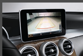
Actieve parkeerassistent met achttuit-rijcamera (235+218)