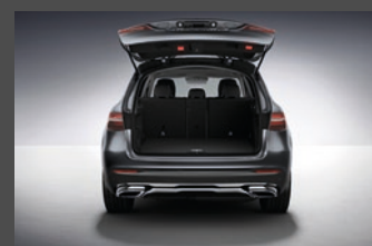
EASY-PACK ACHTERKLEP (890)