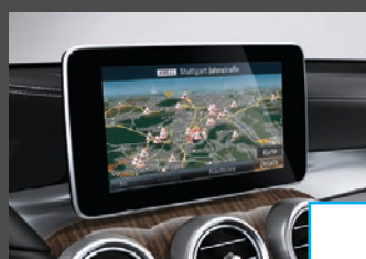
COMAND Online (531) € 2.420