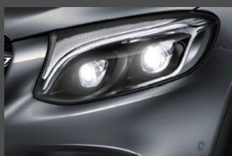
Intelligent Light System (642)