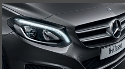
High-performance led-koplampen (632)