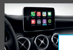
Smartphone integratie (14U) € 363