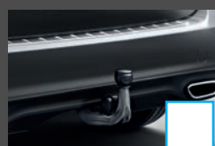
Trekhaak 3) (550) € 956