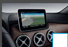
COMAND Online (531) € 2.118