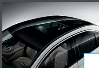
Panoramaschuifdak (413) € 2.142 voor Limousine € 1.718 voor Estate