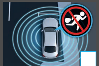
Antidiefstalpakket (P54) € 484