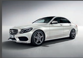
- AMG Line exterieur inclusief lager liggend sportonderstel (P31)