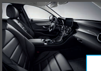
Lederen bekleding (XXX) € 1.984