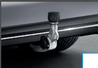
Trekhaak 1) (550) € 1.016