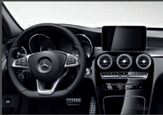
- AMG Line interieur inclusief sportstoelen en lederen sportstuur (P29)