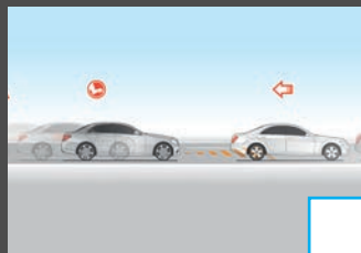
Rijassistentiepakket (23P) € 2.541