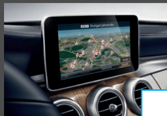
COMAND Online (531) € 2.420