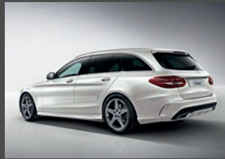
18" vijfspaaks lichtmetalen AMG velgen (782)