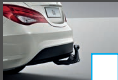
Trekhaak (550) € 956