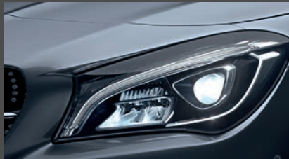
High-performance led-koplampen (632)