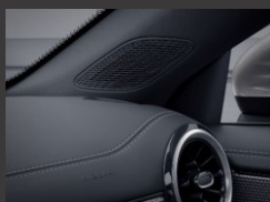
Advanced Sound System (853)