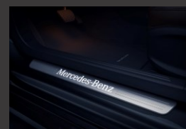
Verlichte instaplijsten (U25)