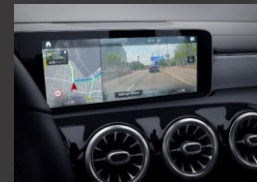
Augmented reality voor navigatie (U19)